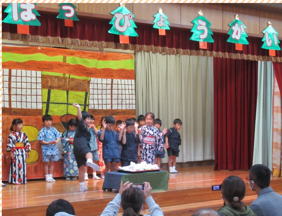
*年長組 生活発表会 劇『まんじゅうこわい』から*

絵本で親しんだお話を、自分たちでセリフや動きを考え、いきいきとした姿の劇遊びを発表します。